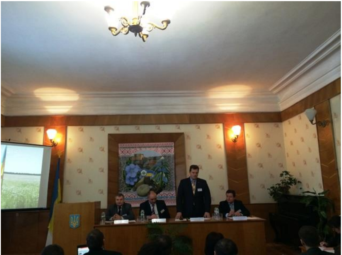
Конференцію відкриває віце-президент НААН Максим Мельничук